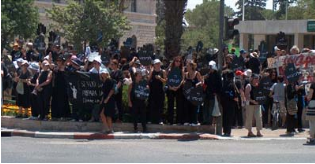
Mahnwache der Women in Black Jerusalem, Hagar Square (Pariser Platz)

In Israel sind die Women in Black Mitglied der Coalition of Women for Peace , einem Verband, in dem 10 Frauen-Friedensgruppen organisiert sind und der auch unabhängig von den Aktivitäten seiner Mitglieder in vielfältiger Weise international tätig ist. Er wurde nach dem Ausbruch der zweiten (Al-Aqsa-)Intifada im September 2000 gegründet und ist heute eine führende Stimme der Friedensbewegung.