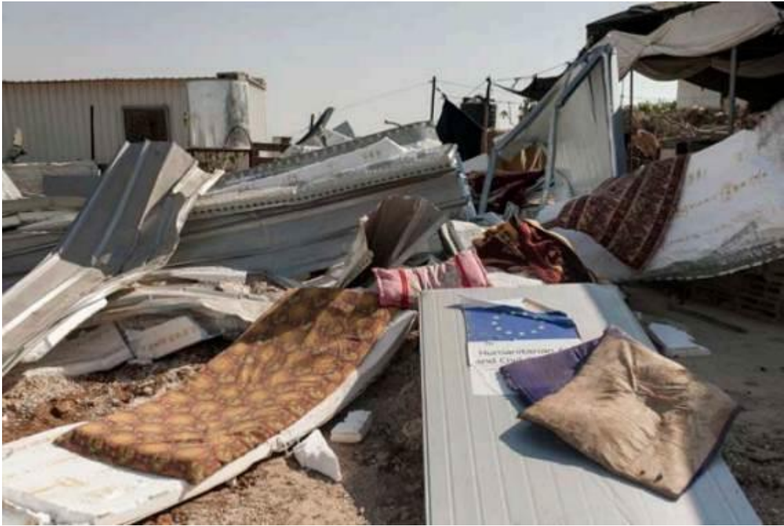
Die Habseligkeiten einer palästinensischen Familie liegen verstreut auf dem Boden, nachdem das Haus zuvor von israelischen Streitkräften im Dorf Umm Al-Khair im besetzten Westjordanland zerstört worden war, am 9. August 2016