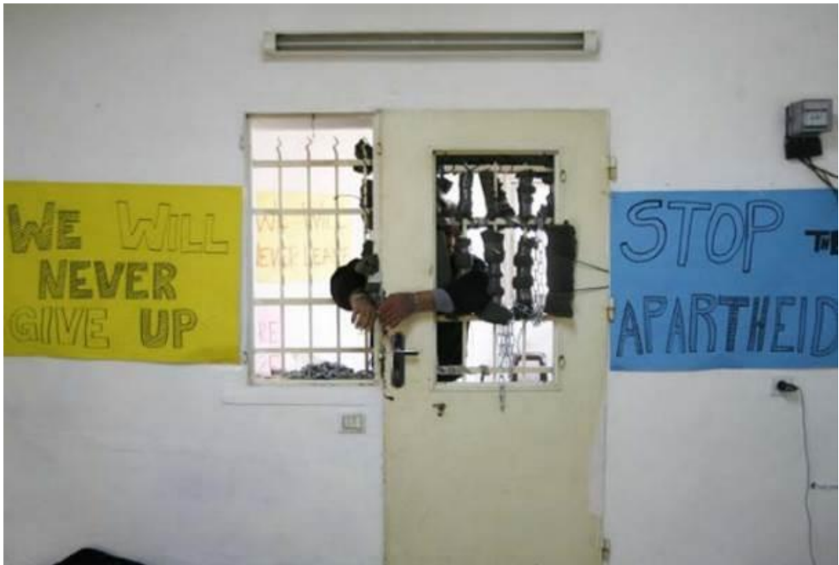
Ein Mitglied der palästinensischen Familie Hanun verschließt am 17. April 2009 die Tür seines Hauses im Viertel Sheikh Jarrah im besetzten Osten Jerusalems mit einer Kette, um zu protestieren, nachdem ein israelisches Gericht im März entschieden hatte, das Eigentum an ihrem Haus einer jüdischen Siedlerorganisation zu übertragen