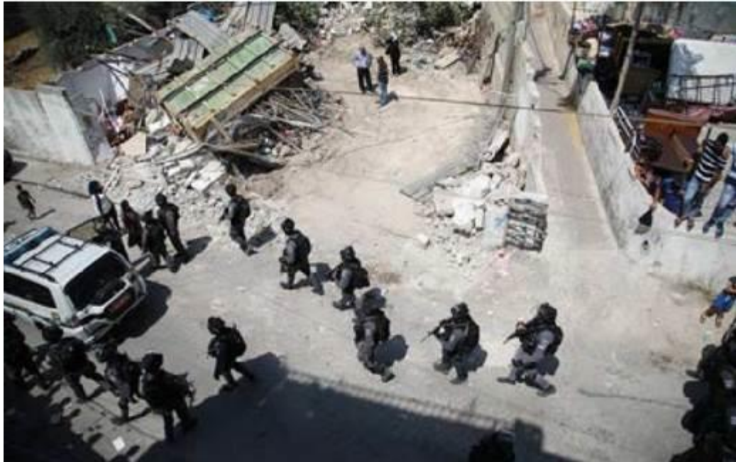
Ein Gebäude, das Palästinensern gehört, wird unter Beobachtung der israelischen Streitkräfte im Stadtteil Silwan im besetzten Ostjerusalem mit Bulldozern abgerissen, am 29. Juni 2021