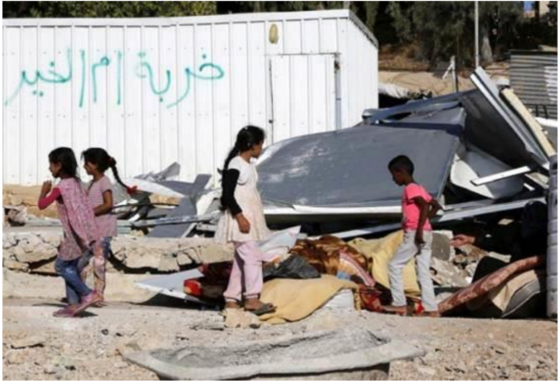
Kinder inspizieren die Trümmer, nachdem die israelischen Behörden im August eine Reihe von palästinensischen Häusern abgerissen haben, die ohne Genehmigung in dem Dorf Umm Al-Khair im besetzten Westjordanland gebaut wurden 9. August 2016