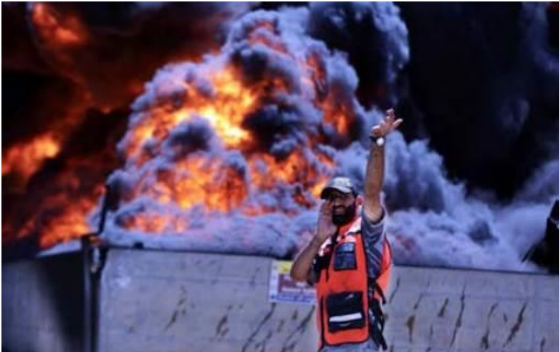
Das einzige Kraftwerk des Gazastreifens Treibstofflager des Kraftwerks ist in Flammen, nach einem israelischen Luftangriff am 29. Juli 2014