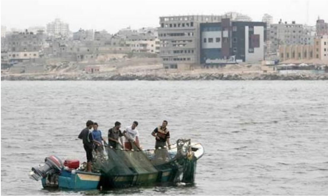
Palästinensische Fischer bereiten ihre Netze in der Nähe des Hafens von Gaza-Stadt im Gazastreifen vor, am 30. September 2012, einen Tag, nachdem ein palästinensischer Fischer von der israelischen Marine, die die Fischereibeschränkungen verschärft hat, getötet und ein weiterer verwundet wurde