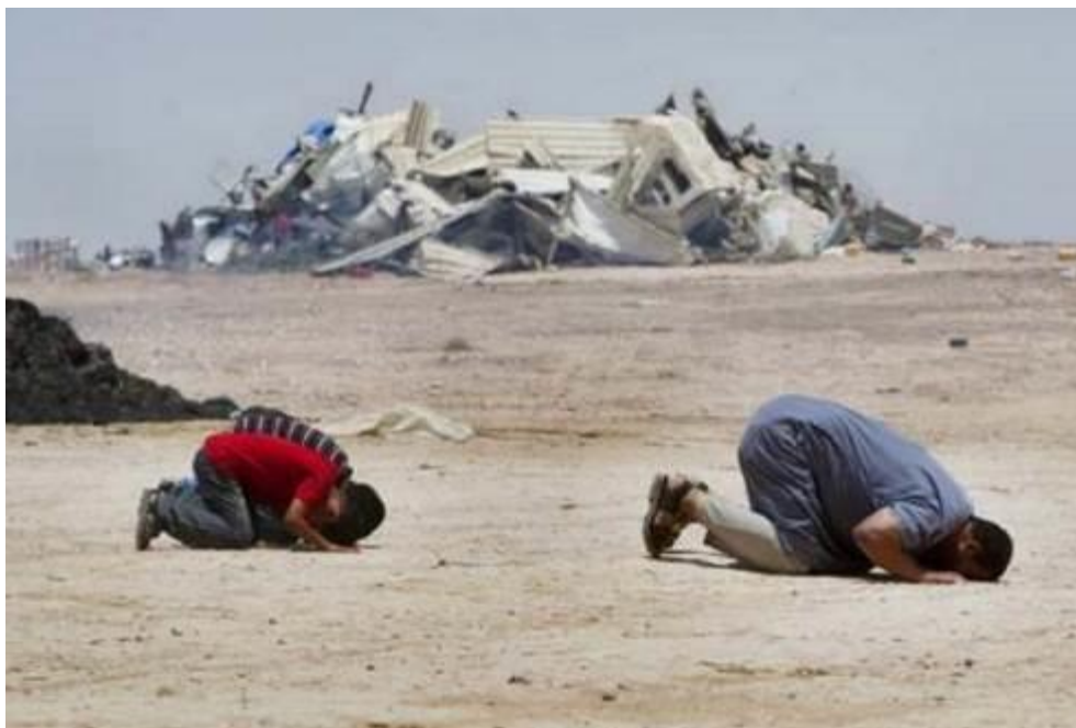
Beduinen der Familie Al-Turi beten in der Nähe ihres zerstörten Hauses, nachdem israelische Behörden in Begleitung von Sicherheitskräften Zelte und Gebäude in dem nicht anerkannten Dorf Al-Araqib in der israelischen Region Negev/Naqab abgerissen haben, am 27. Juli 2010

drei Mitglieder der Familie Al-Turi zu Haftstrafen, nachdem es sie wegen Verbrechen im Zusammenhang mit ihrer Menschenrechtsarbeit für schuldig befunden hatte.