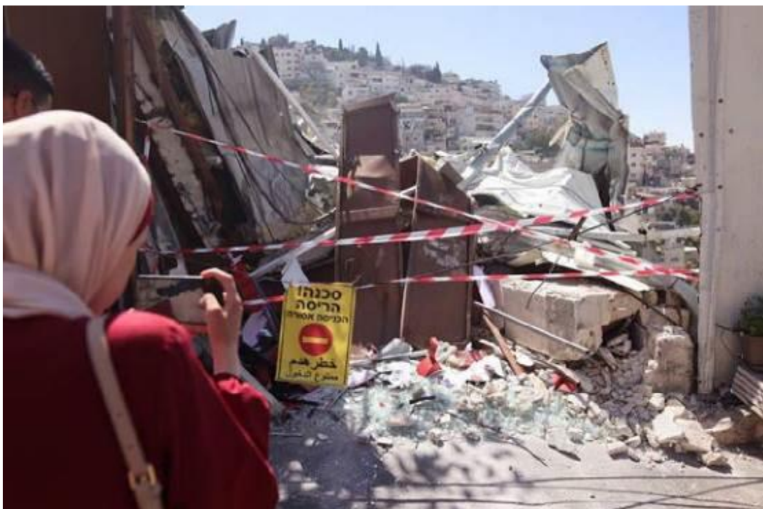
Palästinensische Anwohner stehen vor den Trümmern eines von den israelischen Behörden zerstörten Geschäfts im Stadtteil Silwan im besetzten Ostjerusalem, am 29. Juni 2021

Verhaftungen führen oft zu anderen Formen des Missbrauchs. Im Laufe der Jahre haben Amnesty International und andere Organisationen dokumentiert, wie israelische Sicherheitskräfte unnötige Gewalt angewendet haben, um palästinensische Kinder in Ostjerusalem und anderswo in den OPT zu verhaften oder festzuhalten.