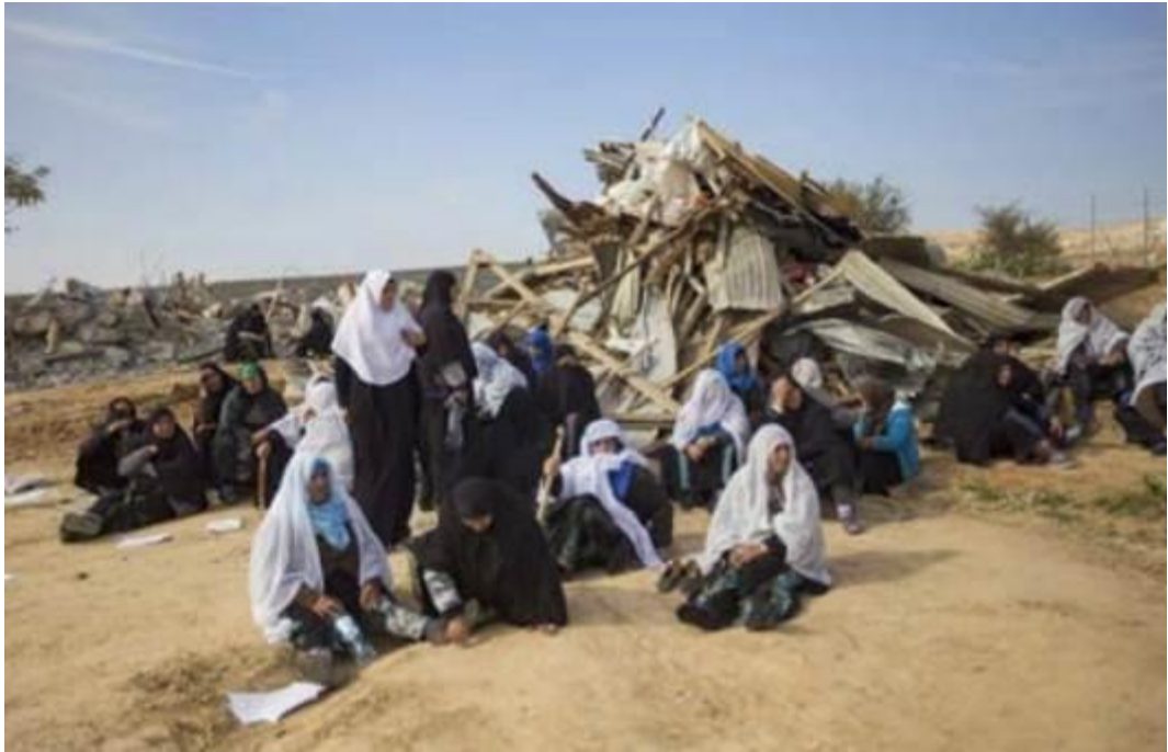
Beduinenfrauen sitzen neben den Ruinen ihrer zerstörten Häuser in dem nicht anerkannten Beduinen Dorf Umm Al-Hiran, in der israelischen Region Negev/Naqab, am 18. Januar 2017