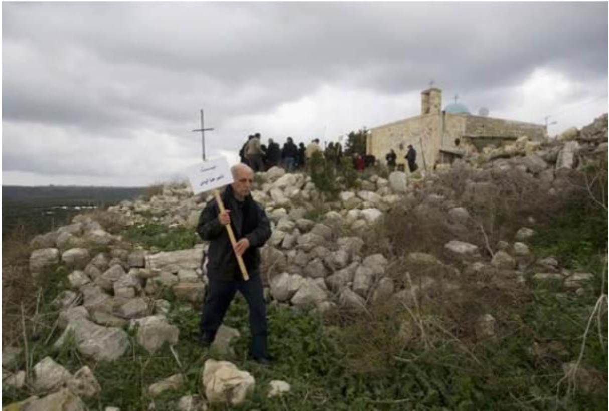
Ein palästinensischer Mann geht in den Trümmern seines palästinensischen Heimatdorfes Iqrit in der Region Galläa in Israel spazieren, um bei einem Besuch anlässlich des Weihnachtsfestes im Dezember den Namen des Besitzers eines zerstörten Hauses anzubringen – Foto 25. Dezember 2011 © Ahmad Gharabli / AFP via Getty Images

Die Kampagne der Gemeinde, in das Dorf zurückzukehren, geht weiter, obwohl Israel dies immer wieder leugnet und versucht, es zu verhindern. Shadia Murqos Sbeit fügte hinzu: