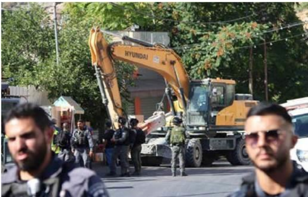
Israelische Behörden zerstören ein palästinensisches Geschäft im Al-Bustan-Gebiet des Stadtteils Silwan Viertel des besetzten Ost Jerusalem, am 29. Juni 2021