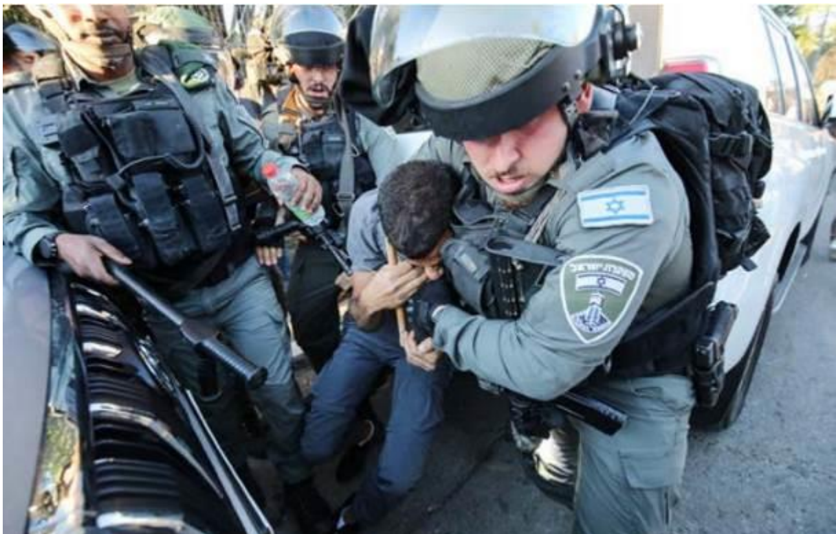
Israelische Streitkräfte greifen in eine Demonstration von Palästinensern anlässlich des 73. Jahrestages der Nakba im Stadtteil Sheikh Jarrah im besetzten Ostjerusalem ein 15. Mai 2011