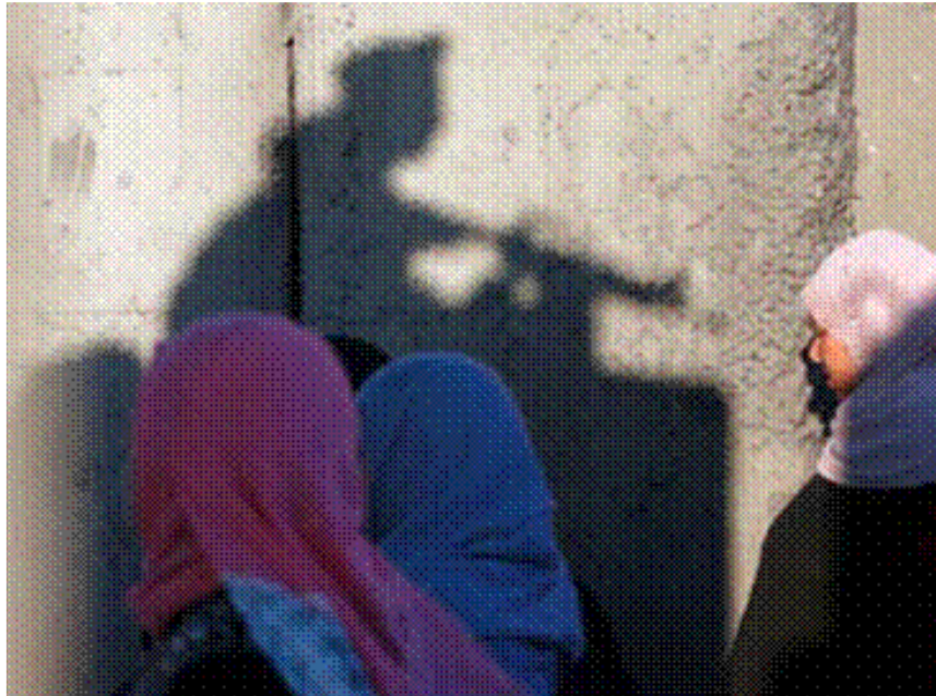
Palästinenser warten am Qalandia-Kontrollpunkt zwischen Ramallah und Ostjerusalem im besetzten Westjordanland auf dem Weg zur Al-AqsaMoschee in Ostjerusalem zum ersten Freitagsgebet des heiligen muslimischen Monats Ramadan im Juni 2217 - Foto: am 2. Juni 2017© Abbas Momani / AFP via Getty Images

Im Jahr 2008 verpflichtete sich Israel als einmalige diplomatische Geste gegenüber den palästinensischen Behörden, 50.000 Anträge auf Familienzusammenführung zu bewilligen. Berichten zufolge hat Israel nur denjenigen Anträgen stattgegeben, die sich zu diesem Zeitpunkt physisch in den palästinensischen Gebieten aufhielten, wobei circa 35.000 Anträge genehmigt wurden. Es gibt jedoch keine öffentlich zugänglichen Informationen darüber, wie vielen der 35.000 Personen tatsächlich ein dauerhafter Aufenthaltsstatus gewährt wurde.