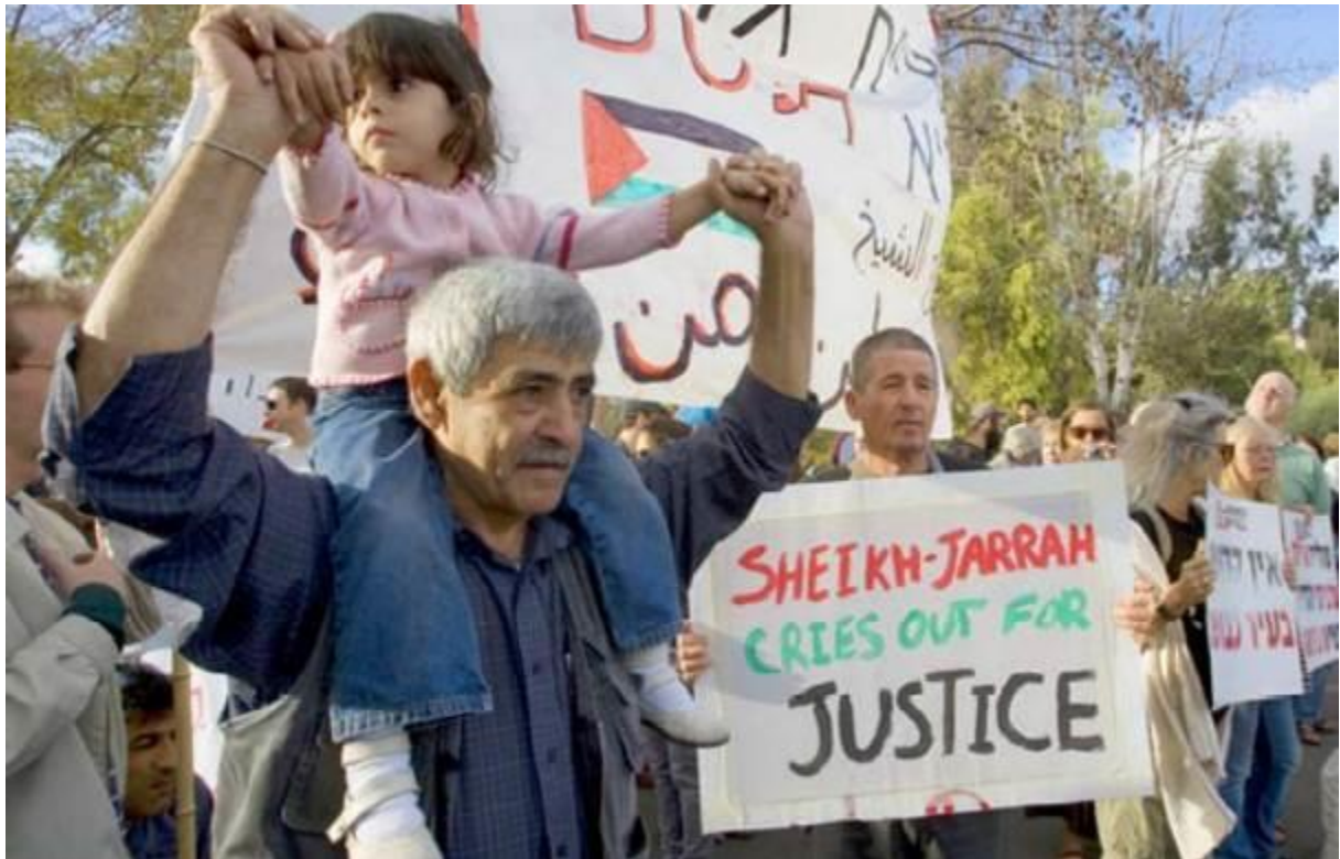
Palästinensische, israelische und ausländische Aktivisten halten Anti-Siedlungs- und Anti-Besatzungs-Plakate vor einem von jüdischen Siedlern besetzten palästinensischen Haus im Stadtteil Sheikh Jarrah im besetzten Ostjerusalem während einer wöchentlichen Protestaktion gegen israelische Siedlungen am 29. Oktober 2010