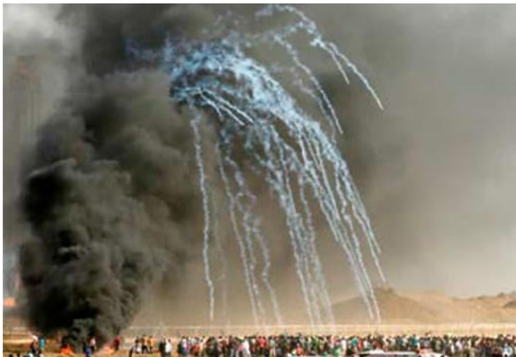
Palästinensische Demonstranten gehen in Deckung, nachdem israelische Streitkräfte Tränengaskanister während einer Demonstration entlang der Grenze zwischen dem Gaza-Streifen und Israel, östlich von Gaza-Stadt abfeuerten, bei der Palästinenser getötet und schwer verletzt wurden, am 22. Juni 2018

Bis Ende des Jahres 2019 töteten die israelischen Streitkräfte 214 Zivilisten, darunter 46 Kinder, und verletzten mehr als 8.000 weitere mit scharfer Munition. Bei insgesamt 156 der Verletzten mussten nach Angaben von OCHA Gliedmaßen amputiert werden. Mehr als 1.200 Patienten benötigen eine langfristige, komplexe und teure Therapie und Rehabilitation, und Zehntausende weitere benötigen psychosoziale Unterstützung. Nichts davon können die Ressourcen in Gaza bereitstellen.