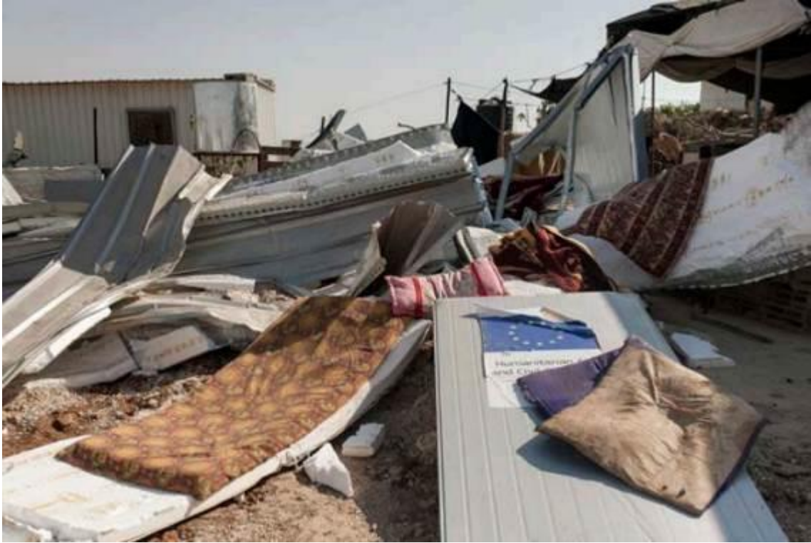
Die Habseligkeiten einer palästinensischen Familie liegen verstreut auf dem Boden, nachdem das Haus zuvor von israelischen Streitkräften im Dorf Umm Al-Khair im besetzten Westjordanland zerstört worden war, am 9. August 2016