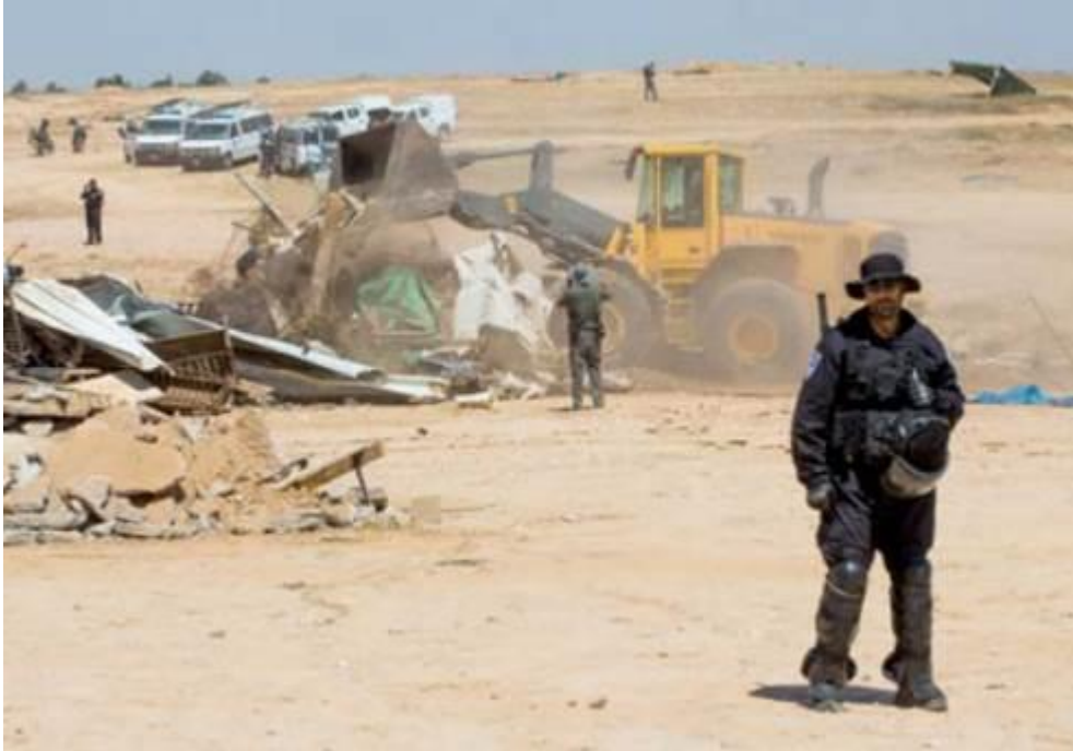
Ein israelischer Polizeibeamter beobachtet, wie ein Bulldozer das Haus einer Beduinenfamilie im nicht anerkannten Dorf AlAraqib in der Region Negev/Naqab Region von Israel abreißt, am 12. Juni 2014