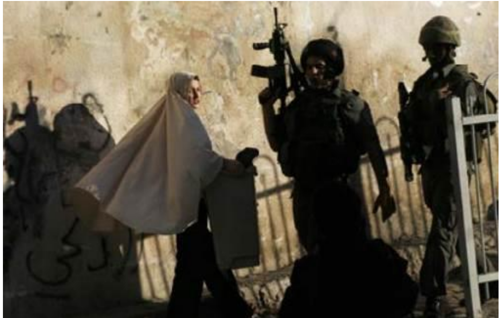
Eine palästinensische Frau geht während der Zerstörung eines palästinensischen Hauses durch Mitarbeiter der Jerusalemer Stadtverwaltung im Silwan-Viertel des besetzten Ostjerusalems am 5. Nov. 2008 an israelischen Grenzpolizisten vorbei.