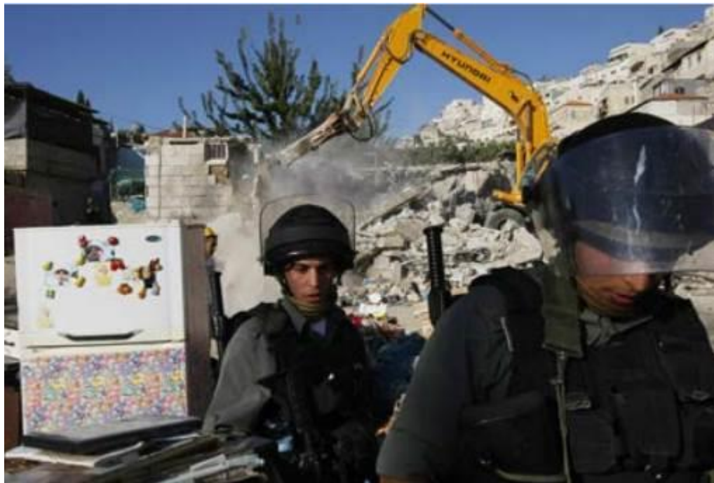
Israelische Polizisten bewachen den Abriss eines Hauses mit dem Bulldozer im Silwan-Viertel des besetzten Ostjerusalems am 5. Nov. 2008.