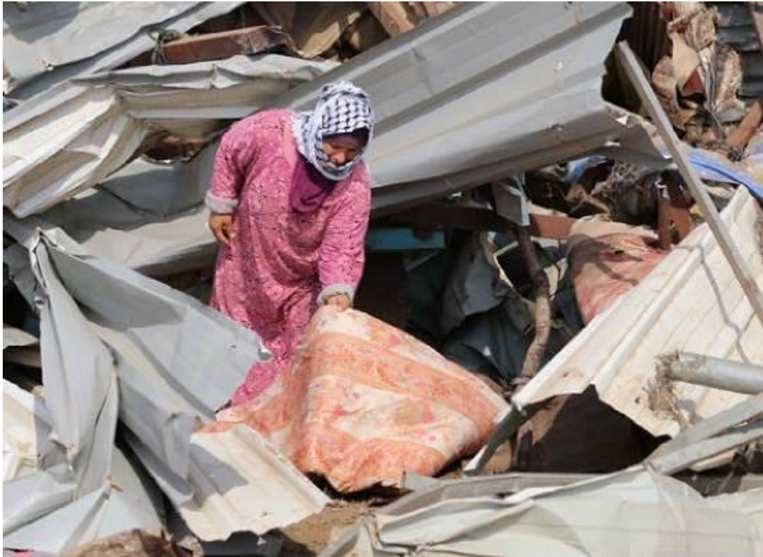
Eine palästinensische Frau begutachtet die an ihrem Haus verursachten Schäden, nachdem die israelischen Streitkräfte es am Vortag in der Ortschaft Al-Hadidiya im Jordantal im besetzten Westjordanland zerstört hatten, am 11. Oktober 2018. Der Abriss erfolgte, weil die israelische Genehmigung für den Bau des Gebäudes fehlte.

Keines der nicht anerkannten Beduinendörfer in der israelischen Region Negev/Naqab ist ordnungsgemäß an das nationale Wassernetz angeschlossen, so dass die Dorfbewohner über teure Drittanbieter, eine zentrale Wasserstelle im Dorf oder eine zentrale Wasserstelle in einem Nachbardorf Wasser beziehen. Sie sind außerdem zwangsweise auf Generatoren für Strom angewiesen. Die Bewohner der nahegelegenen jüdischen Ortschaften kommen dagegen in den Genuss staatlicher Dienstleistungen wie fließendes Wasser, Strom und Zugang zu kommunalen Abwassersystemen.