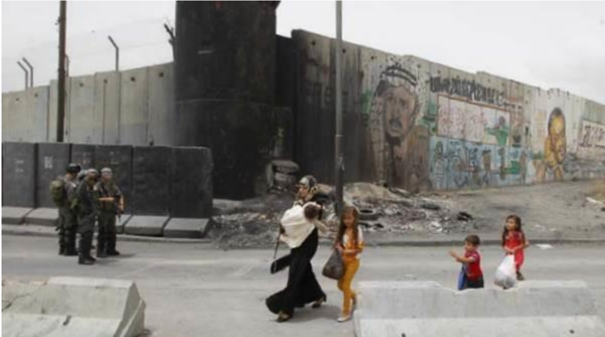
Eine palästinensische Frau und Kinder gehen an den israelischen Streitkräften vorbei, die vor dem Qalandia-Kontrollpunkt in der Nähe der Stadt Ramallah im Westjordanland Wache stehen, Foto: 5. Juni 2014 © Abbas Momani / AFP via Getty Images

„Seit er begann, war die ganze Situation mit dem Familienzusammenführungsprozess war von Anfang an extrem schwierig, aber nichts ist vergleichbar mit dem Leid, das ich jetzt ohne eine Genehmigung erlebe. Seit meine Aufenthaltsgenehmigung 2017 aufgehoben wurde, konnte ich keine dauerhafte Arbeit finden. Ich arbeite auf dem Bau. Die Fahrer, die Arbeiter wie mich in ihren Autos mitnehmen, weigern sich, mich mitzunehmen, weil ich keine Genehmigung habe. Sie befürchten, dass sie verhaftet werden und eine Geldstrafe zahlen müssen, wenn sie mit einem Arbeiter ohne Genehmigung erwischt werden. In den letzten vier Monaten war es besonders schwierig; ich hatte überhaupt keine Arbeit und musste mir Geld von Freunden und Verwandten leihen, um über die Runden zu kommen. Die Schulden steigen immer weiter an.“