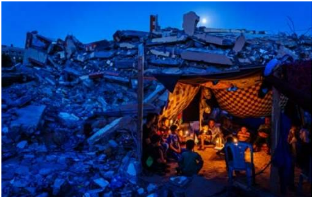
Dutzende von palästinensischen Kindern und Familienmitglieder nehmen an einer Mahnwache bei Kerzenlicht auf den Trümmern Häuser, die durch einen israelischen Militärschlag zerstörten Häuser zum Gedenken an Kinder und andere Zivilisten, die während des 11-tägigen Konflikts zwischen Israel und palästinensischen bewaffneten Gruppen getötet wurden, in Gaza-Stadt im Gazastreifen, am 25. Mai 2021 © Marcus Yam / Los Angeles Time .