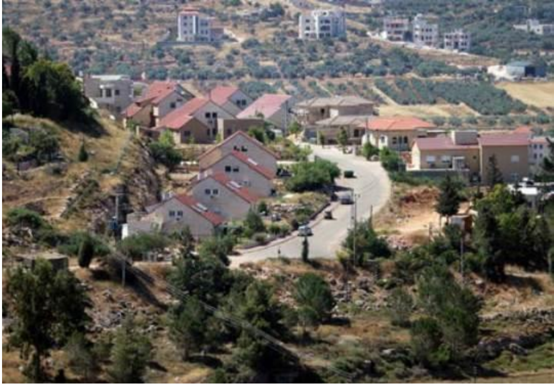
Die israelische Siedlung Shilo, wie man sie vom dem Dorf Qaryut im besetzten Westjordanland aus sieht, am 6. Juni 2015