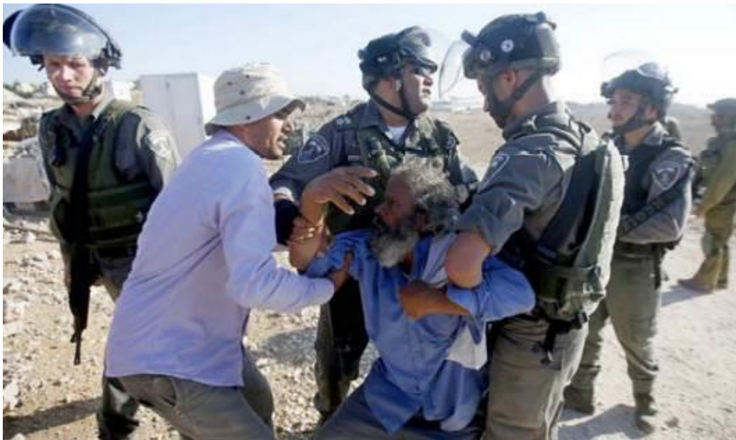
Israelische Sicherheitskräfte ziehen einen Palästinenser weg, der gegen den Abriss mehrerer ohne Genehmigung errichteter palästinensischer Häuser in seinem Dorf Umm Al-Khair im besetzten Westjordanland protestiert hat, am 9. August 2016

Die jüngste Zerstörung in Khirbet Susiya fand am 20. April 2021 statt, als die israelischen Behörden ein Zelt abrissen, in dem eine Familie lebte.