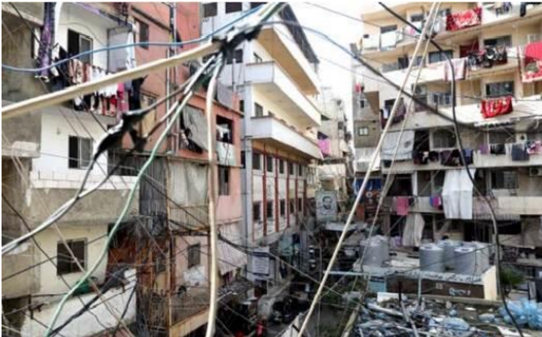
Ein Blick auf das Flüchtlingslager Shatila in Beirut, Libanon, im Januar 2019. Das Lager hat sich zehnfach vergrößert seit seiner Errichtung 1949 und verfügt heute über ca. 500 Wohnungseinheiten für palästinensische Flüchtlinge. verzehnfacht.

Weitere vom Gerichtshof vorgeschlagene Kriterien sind kulturelle Traditionen, Lebensweise Aktivitäten und Absichten für die nahe Zukunft. Die vom Internationalen Gerichtshof aufgestellten Kriterien sind ebenfalls geeignet, das "eigene Land" einer Person zu bestimmen, da sie als Standardmaß für das tatsächliche Bestehen von Bindungen zwischen der Person und dem betreffenden Staat angesehen werden.