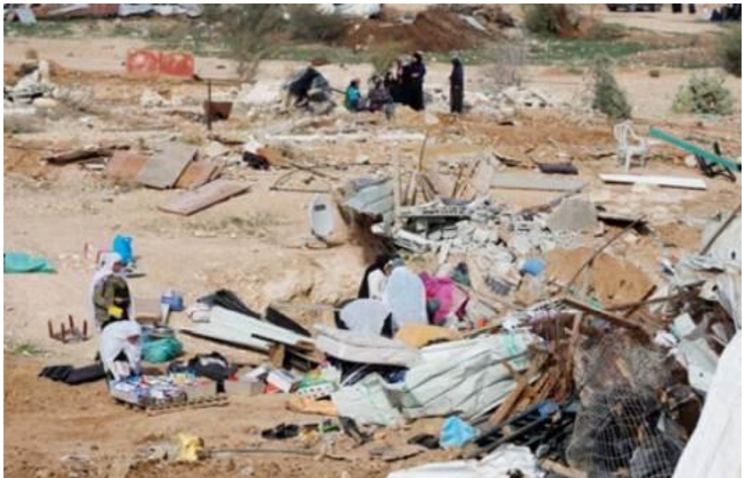
Eine Gruppe von palästinensischen Beduinen packt ihre Sachen, nachdem israelische Sicherheitskräfte Häuser in dem nicht anerkannten Dorf Umm Al-Hiran im Negev/Naqab-Gebiet Israels abgerissen haben, am 18. Januar 2017