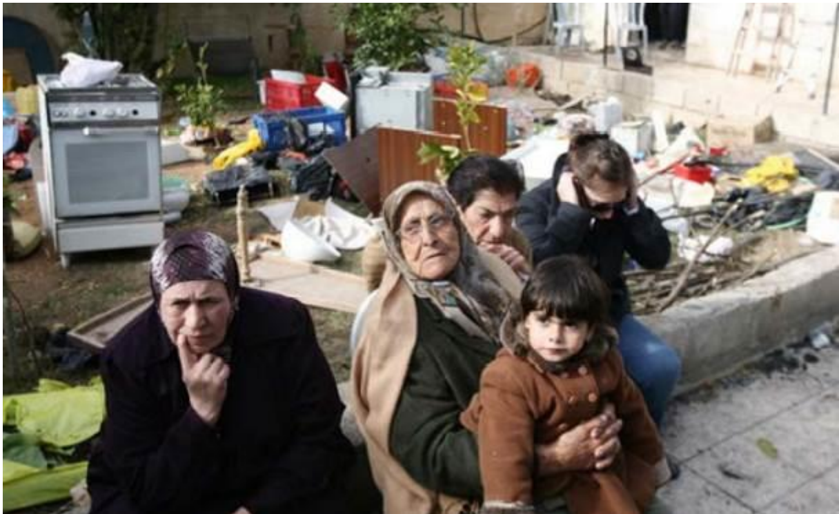
Eine palästinensische Familie, deren Haus von israelischen Siedlern übernommen wurde, sitzt im Innenhof ihres Hauses im Stadtteil Sheikh Jarrah im besetzten Ostjerusalem, am 2. Dezember 2009