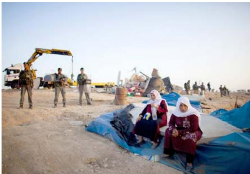
Israelische Grenzpolizisten stehen Wache, während Beduinen Frauen auf den Resten ihres Hauses sitzen, während israelische Behörden ankommen, um die temporären Häuser in dem nicht anerkannten Dorf AlAraqib in der Region Negev/Naqab Region von Israel zu zerstören, am 10. August 2010