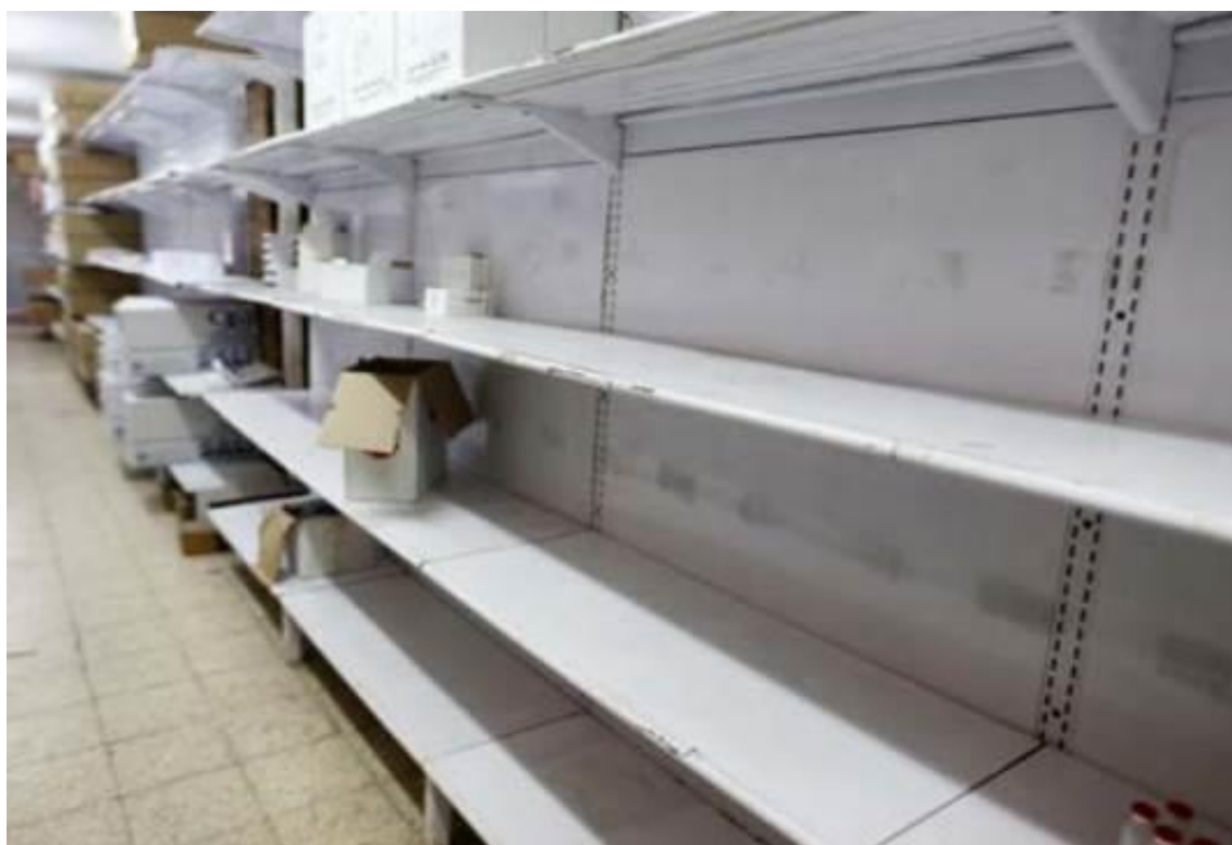
Leere Regale mit Medikamenten im Al-Shifa Krankenhaus am 11. Mai 2017

Wenn mein Sohn hier im Krankenhaus stirbt, ist es nicht der Krebs, der ihn getötet hat, sondern die Besatzung. Die Tatsache, dass wir außerhalb des Gazastreifens nicht einmal eine angemessene medizinische Behandlung bekommen können, führt dazu, dass die Menschen vor der Krankheit kapitulieren. Unser Leben ist erbärmlich, und es wird nicht besser. Wir beten nur, dass diese Ungerechtigkeit eines Tages verschwindet.“