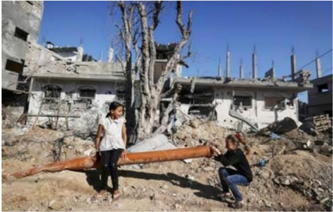
Palästinensische Mädchen spielen neben einem Abwasserrohr inmitten der Trümmer von beschädigten Häusern nach einem Waffenstillstand zwischen Israel und Hamas, in der Stadt Beit Hanun im nördlichen Gaza-Streifen am 24. Mai 2021