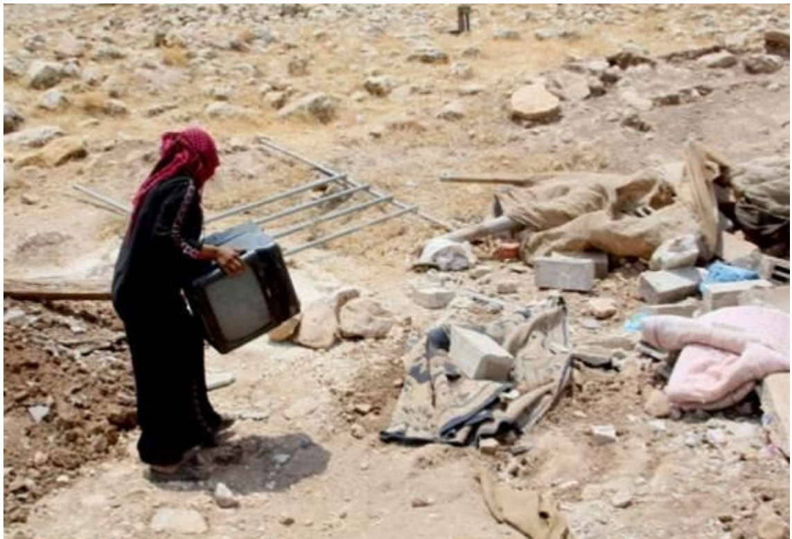
Eine Palästinenserin sammelt ihre Habseligkeiten inmitten der Trümmer ihres Hauses, das von den israelischen Behörden im Dorf Al-Maleh im besetzten Westjordanland abgerissen wurde, am 25. Juni 2012